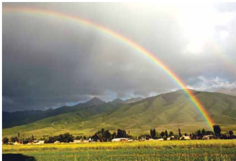
Күн таажысы жаратылыштагы эң кооз көрүнүштөрдүн бири.

аныкташкан, ыңгайлуу учурун болжоп жолго чыгышкан, жоого аттанышкан, жашоо-тиричилигин өткөрүшкөн.