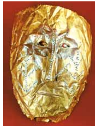
Алтындан жасалган маска. Кыргыз Республикасынын Мамлекеттик тарых музейинин фондусунан.

Көчмөндөрдө болмуштун эч ким таап, чече алгыс табышмактуу сырларын ачууга же аларды өз билгениндей чечмелөөгө тыюу салган көзөмөлчүнүн милдетин аткарып келген ритуал, ырым-жырым, салт-жөрөлгөлөрдүн ордуна отурукташкан маданиятта юридикалык институт-укук (ук+ук) адилеттик бийлигин өз колуна алат. Табияттын тартуусун гана алып, ага тартуу берип туруунун ордуна, гүлдөп өсүүнүн булагы катары коомдук культ чыгарма-