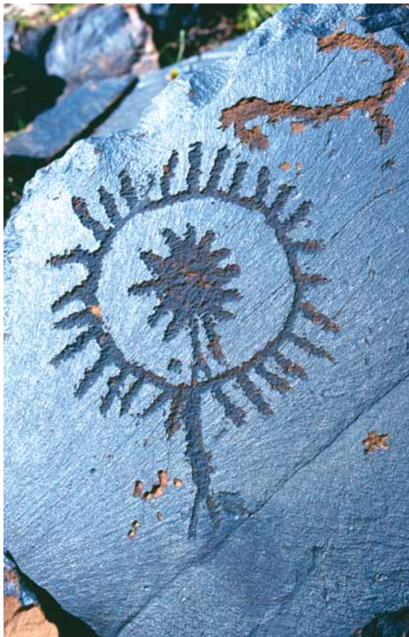
Күнгө табынууну чагылдырган сүрөт. Саймалуу-Таш.

маларында христиандар колдонуп келе жаткан крест белгисин (кыргызча «жагалмай тамга») да жолуктура аласың. Байыркы көчмөндөрдүн, анын ичинде кыргыз урууларынын эн тамгалары кийинки доордогулардын ыйык белгиси, символу болуп калгандыгы табышмак.