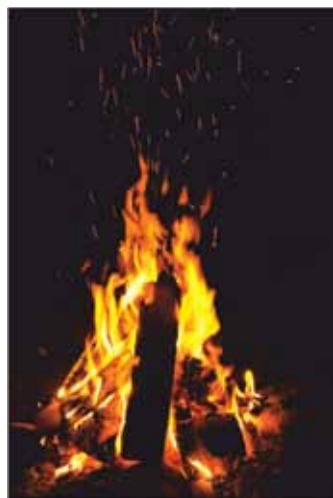
Жаратылыштагы кубулуштардын бири болгон оттун ыйыктыгын кыргыздар бекем туткан.