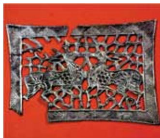
Бугулардын сүрөтү тартылган жасалгалоо буюму. Кыргыз Республикасынын Мамлекеттик тарых музейинин фондусунан.