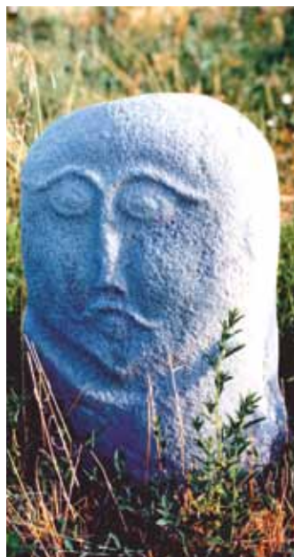
Балбал таштары, аскалардагы тартылган сүрөттөр илгерки тургундардын чеберчилик, чыгармачылык деңгээлин даана чагылдырып турат.

масында байыркы коло доорун жашоо-тиричилигине ылайык Андрон маданияты деп аташкан. Окумуштуулар бул маданияттын аталышын Сибирдеги эстеликтер табылган бир кыштактын атынан улам алышкан. Андрон маданиятынын эң баалуу эстеликтеринин бири болуп «Саймалуу-Таш» чийме сүрөт көркөмканасы (галереясы) эсептелет.