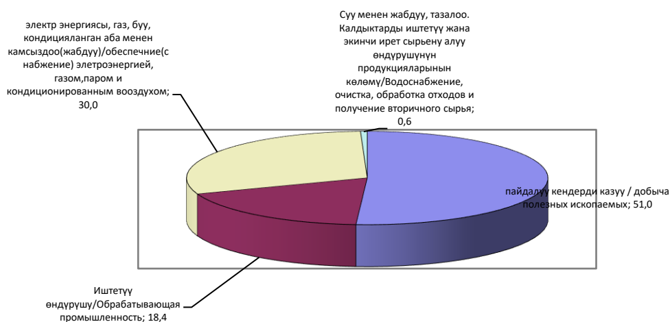
Диаграмма-1: Структура промышленного производства по видам экономической деятельности в январе-апреле 2024года (в процентах к общему объему производства.)

А также объем работ предприятий обеспечивающих водоснабжение, очистку, обработку отходов и получения вторичного сырья составил – 111935,5 тыс.сомов. (табл.3)