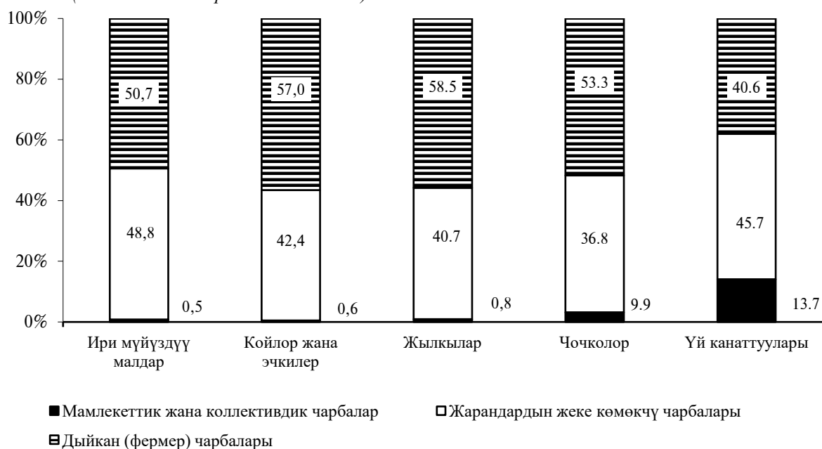
1-график: Чарбалардын категориялары боюнча малдардын жана үй канаттууларынын саны (жыйынтыкка карата пайыз менен)

2021-жылдын аягына карата дыйкан (фермер) чарбаларында жана жарандардын жеке көмөкчү чарбаларында 2020-жылдын тийиштүү мезгилине салыштырганда ири мүйүздүү малдардын жана жылкылардын санынын өсүшү белгиленди, ал эми мамлекеттик жана жамааттык (коллективдик) чарбаларында ири мүйүздүү малды кошпогондо, малдын жана үй канаттууларынын санынын өсүүсү белгиленди.