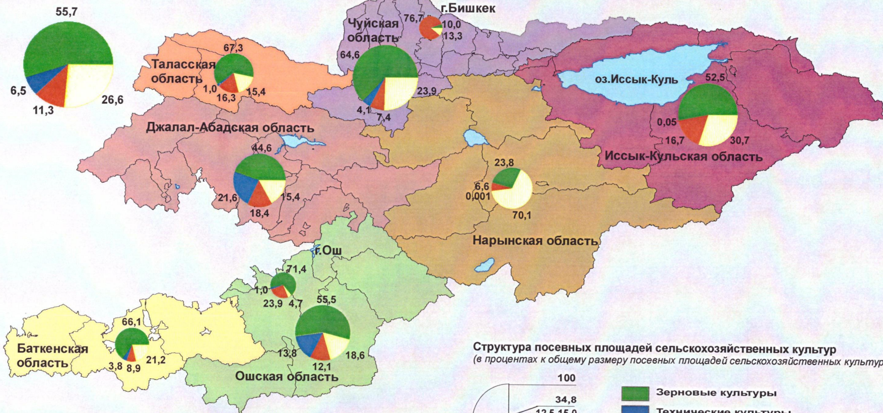
Структура посевных площадей сельскохозяйственных культур (в процентах к общему размеру посевных площадей сельскохозяйственных культур)